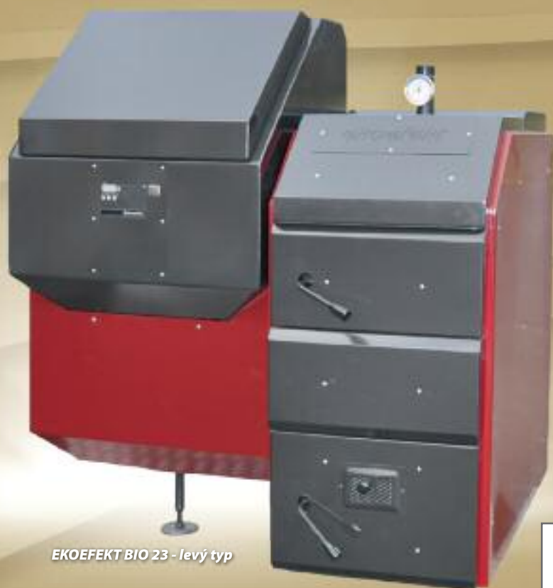
EKOEFECT BIO 23 - levý typ